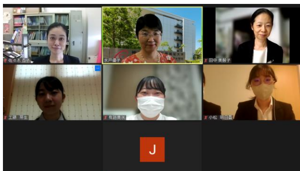
【日本看護技術学会第19回学術集会 卒業研究交流セッションの様子】